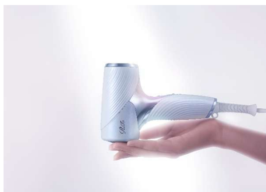
ReFa BEAUTECH DRYER SE

バスルームには、浴びる部位や目的に合わせて使い分けられる4つのモードを搭載したシャワーヘッド「ReFa FINE BUBBLE U」を導入。さらに、「ReFa」のテクノロジーを手のひらサイズに収めたドライヤー「ReFa BEAUTECH DRYER SE」をご用意し、美しい髪へのケアも叶えます。観光やビジネスで疲れた一日の終わりに、お部屋でゆったりとサロン品質のケアをご堪能いただける、ご褒美のようなホテルステイをお届けいたします。